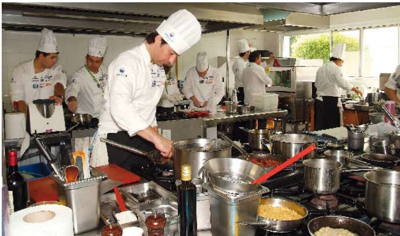
Vista general de las instalaciones de cocina de Ciomijas, espacio en el que se desarrolló el concurso

3ª SEMIFINAL DEL IV CONCURSO COCINERO DEL AÑO (CCA) – MIJAS, 1/6/11